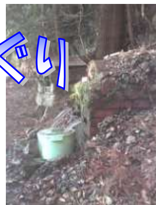
(旧南島町河内 だんのひらのわき水)