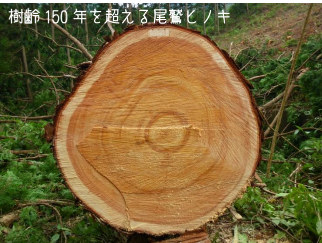
樹齢150年を超える尾鷲ヒノキ